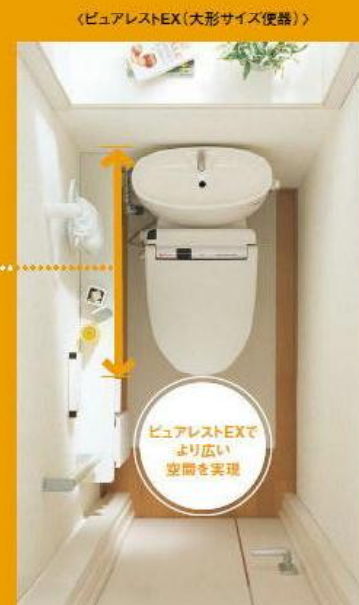
0812スペース※2でピュアレストEXの場合

※1 後ろ壁から便座先端までの寸法 ※2 開口780mm、奥行1235mmの空間