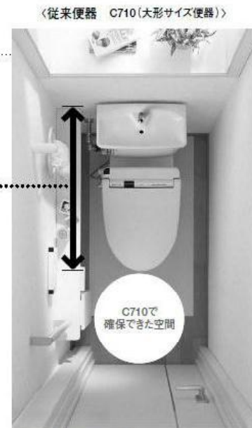
0812スペース※2でC710の場合